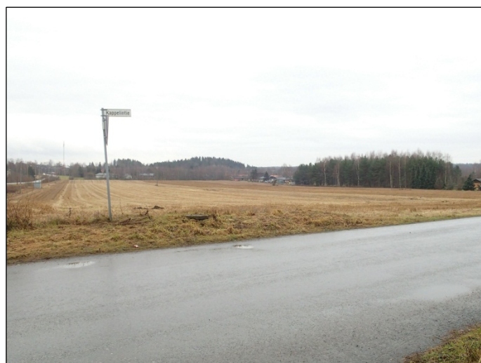
Tutkimusaluetta Kappelitieltä kaakkoon.