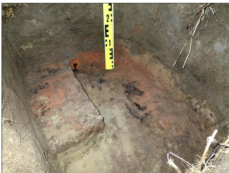
Tulenpidon jälkiä koekuopassa nro 4