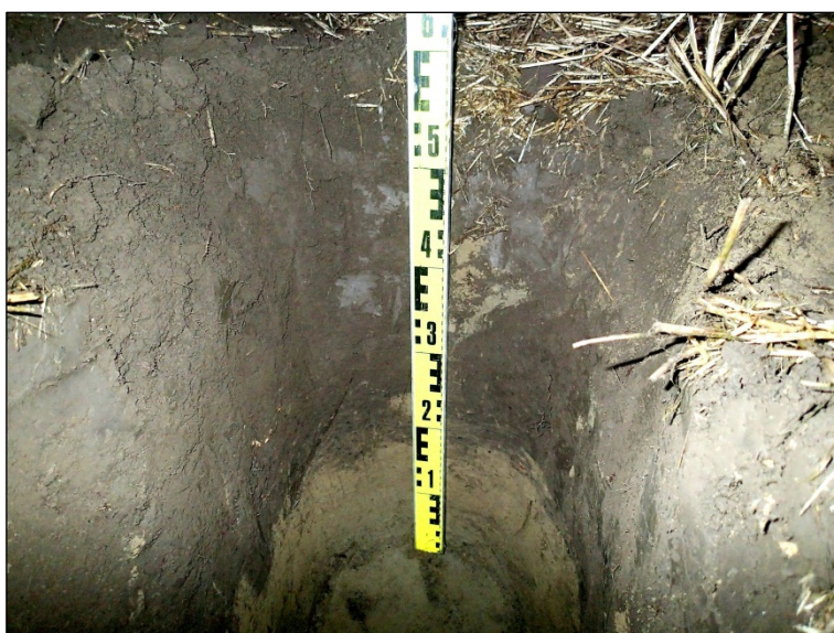
Tavallista paksumpi sekoittunut kerros koekuopasta nro 2, josta piikiven kappale