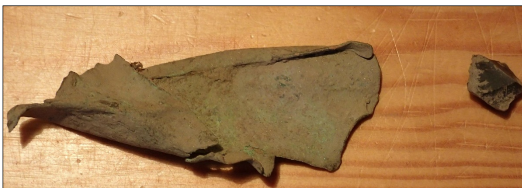
Pronssipellin kappale ja piin kappale (oik)

Rautavarras pellostä, kohdasta N 6754081 E 353498. Pronssipeltti pellostä kohdasta N 6754087 E 353493.