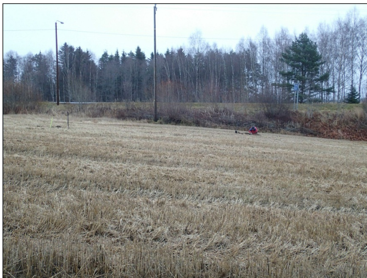
Tasanne purouoman äärellä josta löytöjä. Taustalla Topenontie